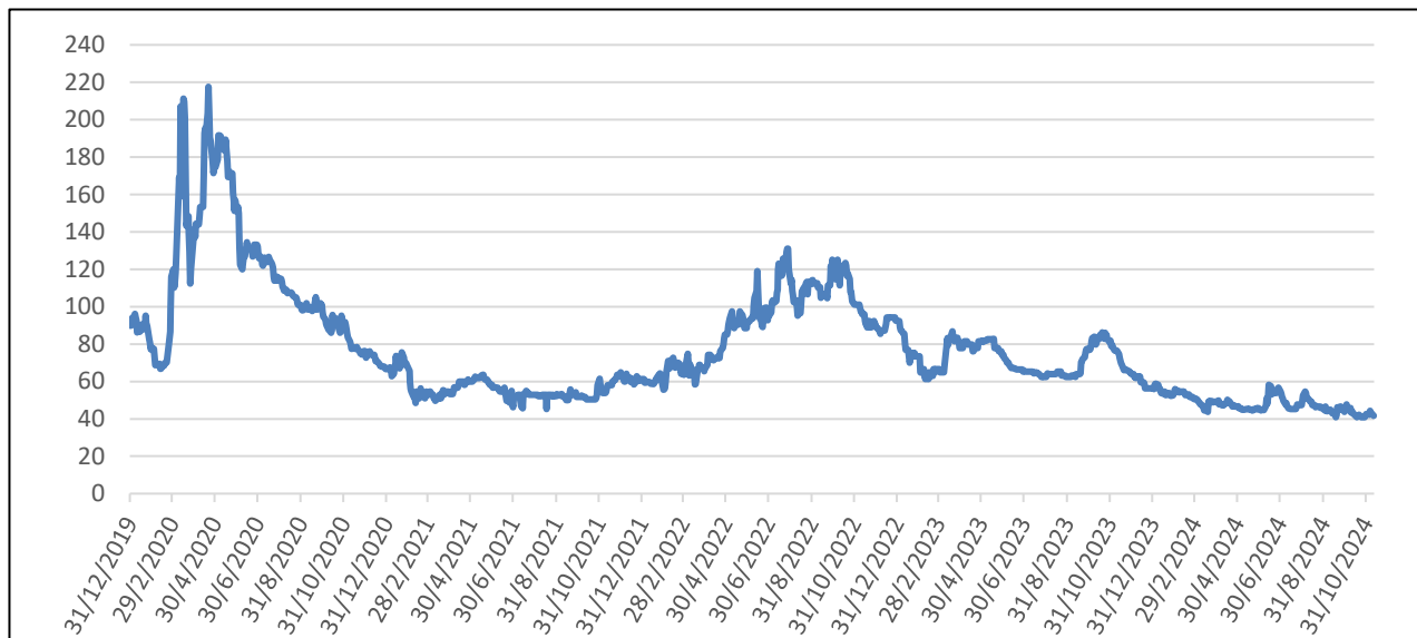
GRAFICO 2: ANDAMENTO CDS REP. ITALIANA A 5 ANNI

In relazione alla rischiosità del Credit Default Swap della Repubblica Italiana, le quotazioni dei derivati registrate nel corso del 2024 sono rimaste in un intervallo fra 41 e 59.