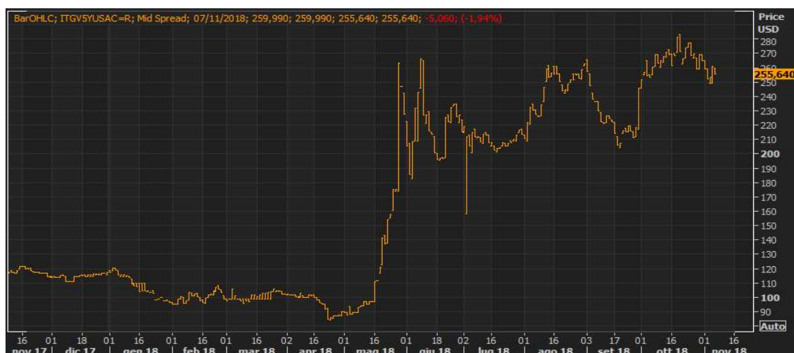
GRAFICO 2: ANDAMENTO CDS REP. ITALIA A 5 ANNI - STORICO (2018)

In riferimento invece alla rischiosità degli investimenti in titoli obbligazionari, in particolare in riferimento ai titoli di stato italiani, nel 2018 si è registrato un miglioramento nella percezione della rischiosità relativa al default dello stato, ciò ha portato ad una riduzione delle quotazioni dei Credit Default Swap collegati.