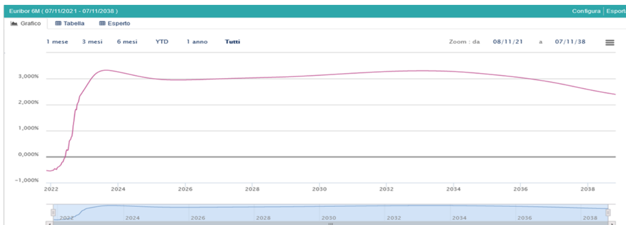
GRAFICO 1: ANDAMENTO DELL'INDICE EURIBOR 6 MESI: STORICO E PREVISIONALE

In relazione alla rischiosità del Credit Default Swap della Repubblica Italiana, le quotazioni dei derivati sono raddoppiate nel corso del 2022 e risultano in leggera diminuzione dal mese di ottobre.