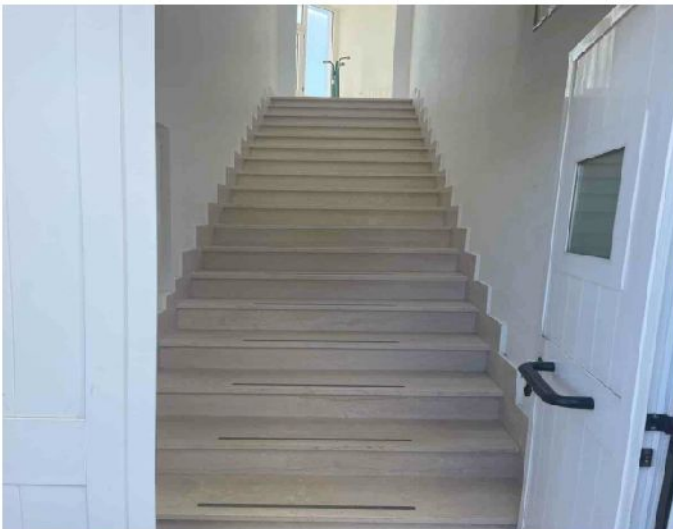
Altro da segnalare