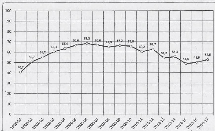
Figura 2 Coperture vaccinali per l'influenza in Italia, negli ultrasessantacinquenni, stagione 1999/00 - 2016/17

È quindi necessario, riconfermare gli obiettivi di copertura già stabiliti dalla pianificazione nazionale (Piano Nazionale Prevenzione Vaccinale) e individuare tutte le modalità necessarie per il raggiungimento di tali obiettivi, soprattutto quelle utili per il raggiungimento dei gruppi a rischio.