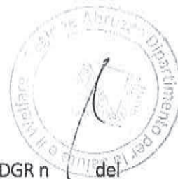
Tabella 1) DGR n. del